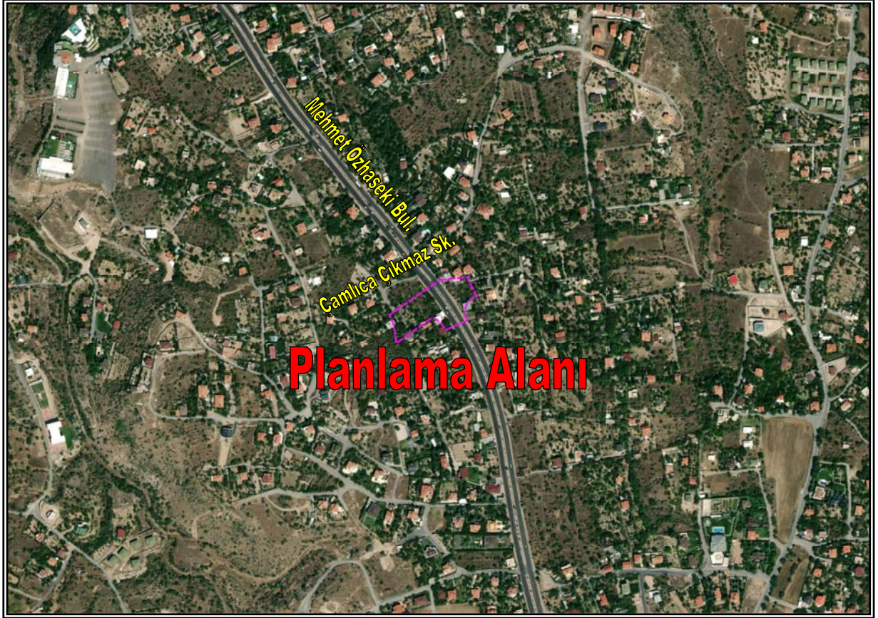
Resim 1: Planlama Alanının Konumu

Planlama alanı düz bir arazi yapısına sahiptir. Bahse konu alanın bir kısmı üzerinde herhangi bir yapılaşma görülmemiş olup bağ-bahçe arazisi statüsünde iken geriye kalan kısmı ise yol olarak kullanılmaktadır. Planlama alanının yakın çevresinde 2 katlı, bağ-bahçe niteliğindeki konut kullanımlı yapılar, cami ve boş araziler yer almaktadır.