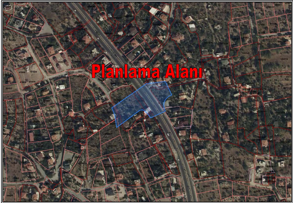
Resim 3: Planlama Alanının Mülkiyet Durumu

Planlama alanı; tapuda Melikgazi İlçesi, Becen Mahallesi sınırları içerisinde, mülkiyeti şahıslara ait 10328 ada 1 ve 2 parsel numaralı taşınmazlar ile tescil harici alan üzerinde bulunmaktadır. (Bkz. Resim 3)